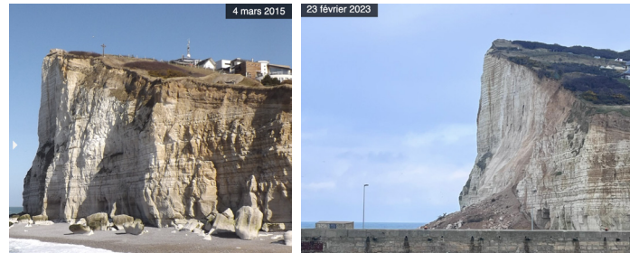
Fécamp mars 2015

Montrez le bon exemple et parlez-en ! ne vous promenez pas en bord de falaise que ce soit en bas comme sur les hauteurs. Nos côtes sont devenues trop fragiles.