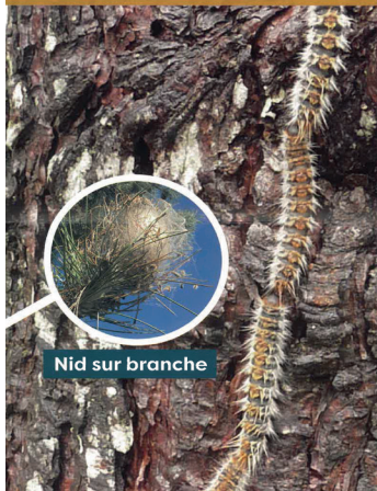
Nid sur branche

Processionnaire du chêne Entre mai et juillet